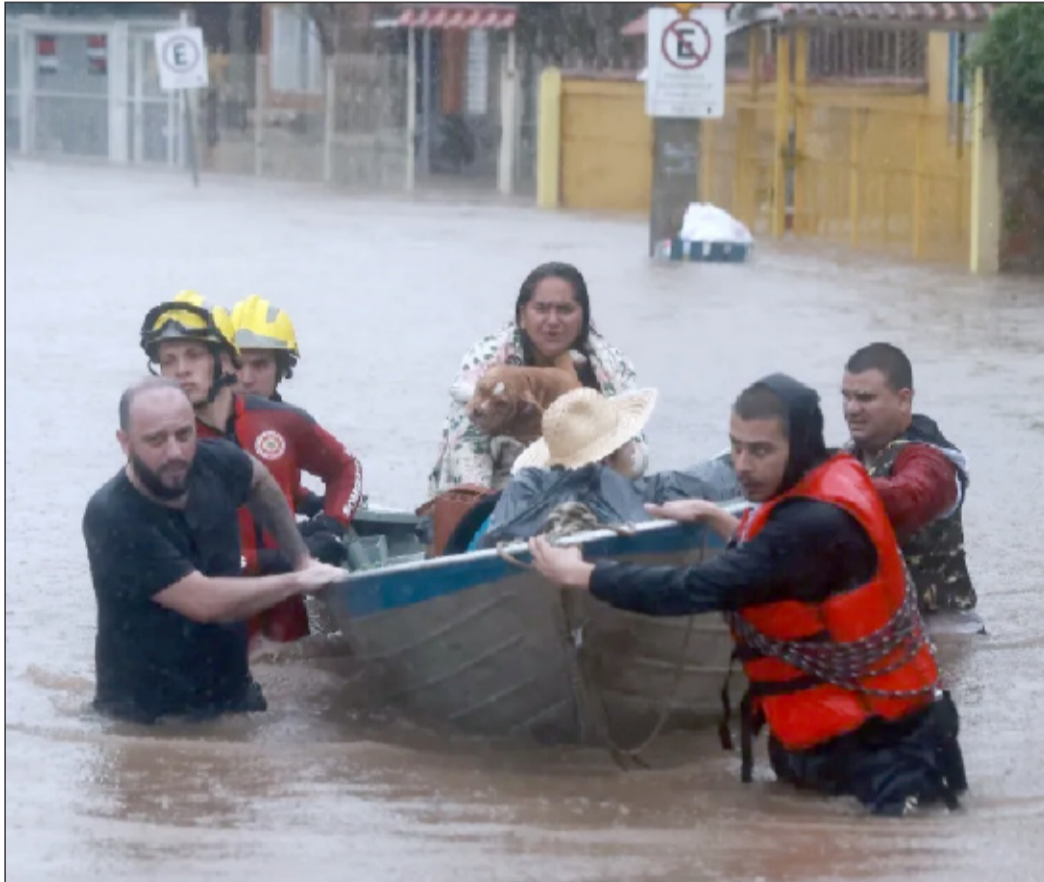
Rio Grande do Sul foi prejudicado em decorrência das enchentes